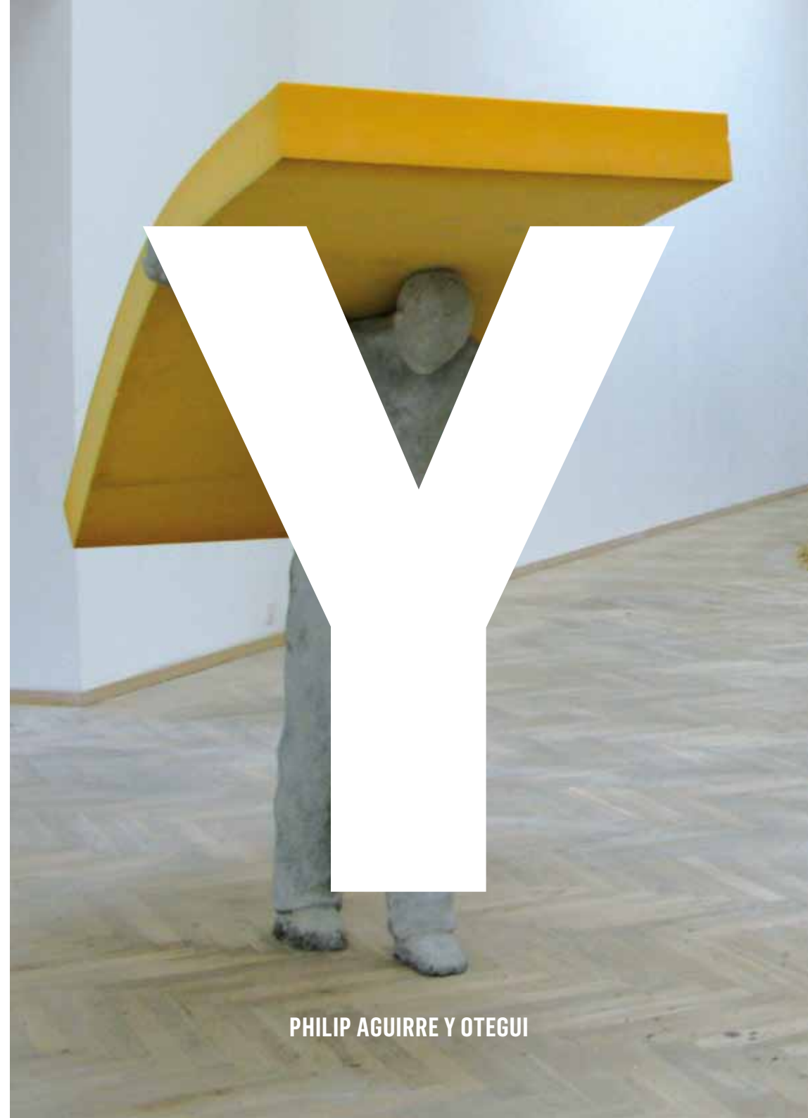
PHILIP AGUIRRE Y OTEGUI

DAVID.FLAMEE@MOMU.BE | +32 3 470 27 77 | +32 478 56 25 43