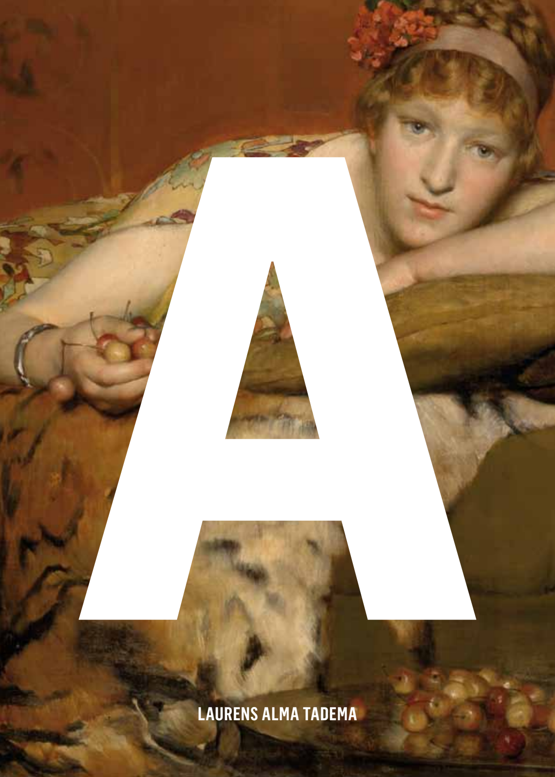
LAURENS ALMA TADEMA